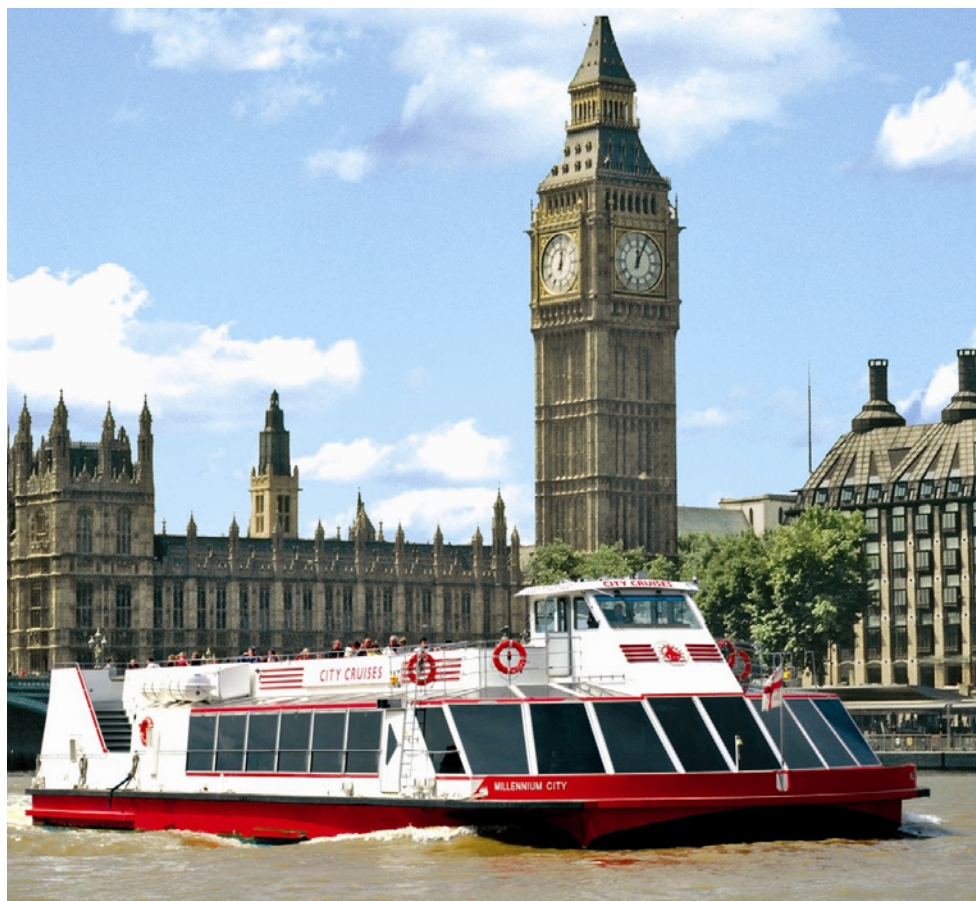
Passeio de Barco City Cruises (foto de divulgação)

A terra da rainha tem milhares de atrativos que conquistam pessoas de todo o mundo. Por todos os cantos é possível ver as tradições e o estilo único dos londrinos. Para começar sua visita faça um passeio com os clássicos ônibus vermelhos de dois andares, assista a troca da guarda do Palácio de Buckingham, visite o Castelo de Windsor, o Parlamento, o Big Ben, a Torre de Londres e a Abadia de Westminster. Depois de todas as paradas obrigatórias, aventure-se a descobrir as coisas mais legais de Londres.