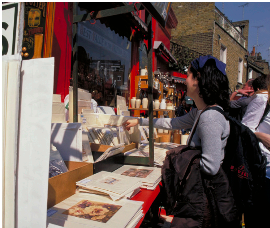
Acima: Harrods (Visit Britain) | Canto Inferior Esquerdo: Portobello Road (Visit Britain)

Prepare-se para usar suas libras nas lojas de departamentos. A Selfridges é uma das mais populares, tem tudo para todos os bolsos. A Marks & Spencer é a mais tradicional. Já a Harrods é a mais luxuosa e exclusiva de Londres, então os preços não tem limite. Para continuar a gastar muito vá até Bond Street , o shopping de luxo mais badalado. Em Notting Hill está a famosa feira de antiguidades Portobello Road , onde há praticamente de tudo! Quem procura estilos variados deve ir até Camden Town . Esse era o lugar preferido de Amy Winehouse. Possui lojas cheias de coisas antigas e exóticas, quiosques e muitos pubs.