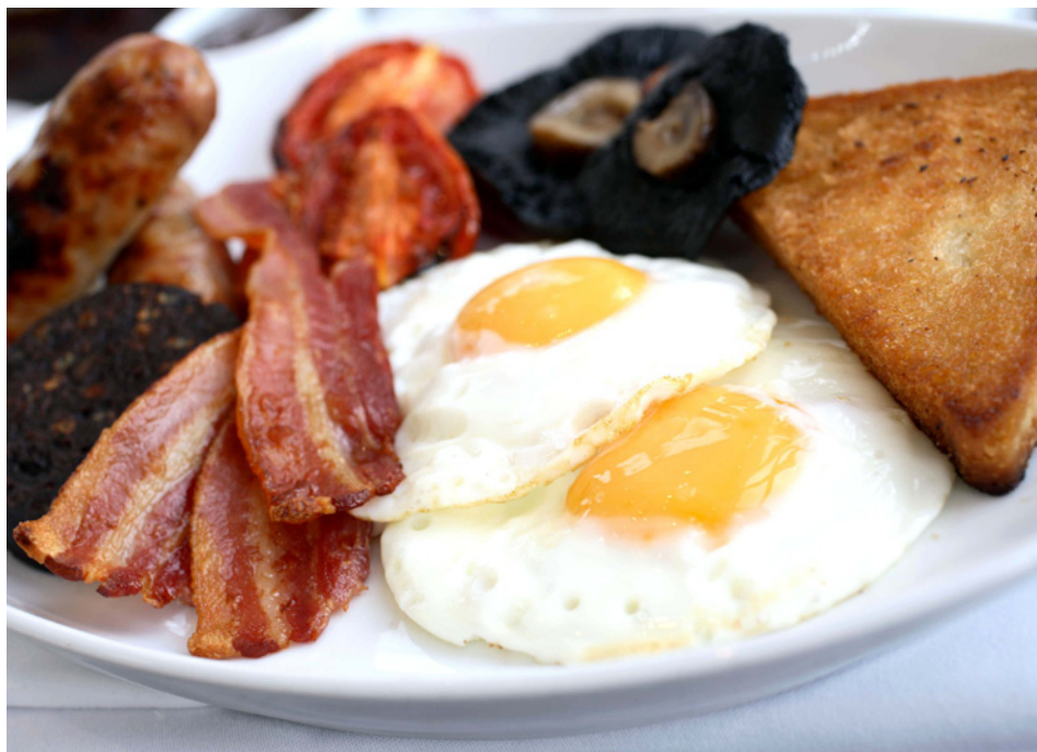
Acima: Pub Punch Tavern (foto de divulgação) | Canto Inferior Esquerdo: British Breakfast no Roast Restaurant (foto de divulgação)

Mergulhe no estilo de vida britânico e experimente o British Breakfast no Roast Restaurant . Localizado no Borough Market, o local oferece a melhor culinária britânica. O prato leva salsichas, ovos fritos, tomates, feijão, cogumelo, batata, pão frito e black pudding. Saboreie também a famosa fish'n'chips (peixe com batata frita) enquanto toma uma pint no happy hour do histórico pub Punch Tavern . Se tiver a chance, experimente o tradicional chá da tarde da Fortnum & Mason . Inaugurada em 1770, a casa é frequentada pela rainha da Inglaterra, Elizabeth II. Outro favorito da rainha são os chocolates da Charbonnel , uma das mais finas e antigas chocolaterias da Inglaterra. Experimente as famosas trufas de champanhe! Para um jantar memorável, experimente o restaurante e bar Hix , no Soho, um dos bairros mais famosos de Londres. Disputado, moderno, serve uma culinária britânica sazonal e coquetéis britânicos históricos.