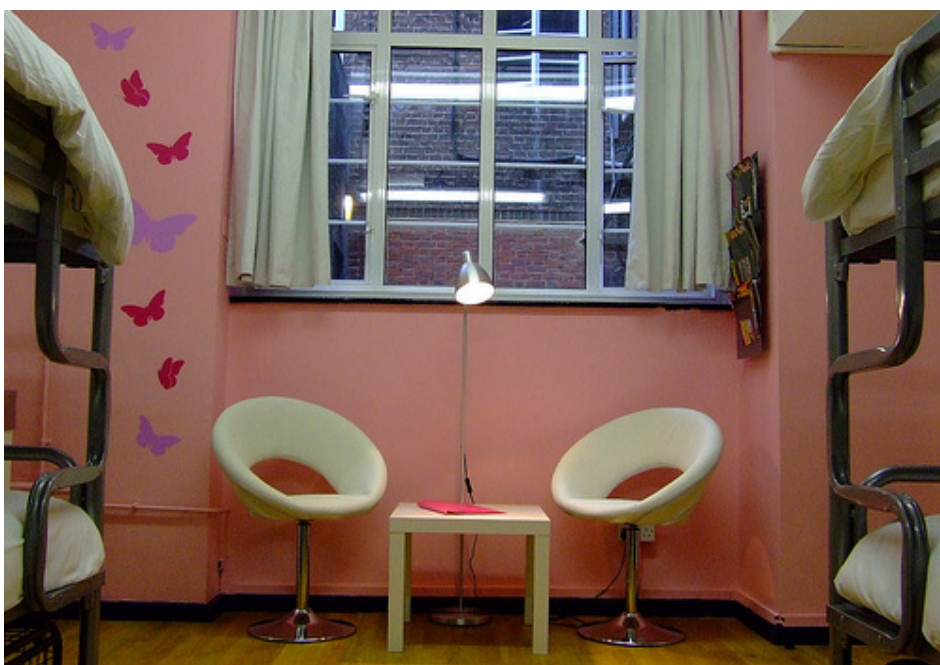
Acima: Hotel Claridge's (foto de divulgação) | Canto Inferior Esquerdo: Generator Hostel London (foto de divulgação)