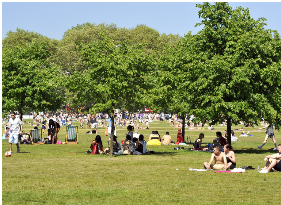
Acima: Somerset House (Visit Britain) | Canto Inferior Esquerdo: Hyde Park (Visit Britain)

O Hyde Park é ideal para uma boa caminhada ou pic-nic com os londrinos. Em frente ao belíssimo edifício Somerset House há um belo pátio onde as pessoas se reúnem no verão para curtir os jatos d'água que saem do chão de granito e ao entardecer o show da iluminação. No inverno o pátio recebe uma grande pista de patinação. Durante o ano todo o local também recebe shows de música e teatro. Para começar o dia muito bem vá ao Corney Barrow CityPoint . Eles oferecem cafés da manhã de champanhe em um pátio bar a céu aberto, uma carta de vinhos completa. Vale também curtir a brisa do Rio Tâmesa em um belo passeio de barco e observar Londres mais atentamente. Quem prefere descansar em um spa, o Chancery Court é a melhor escolha. Foi considerado um dos 10 melhores de Londres, premiado como a melhor massagem e day spa.