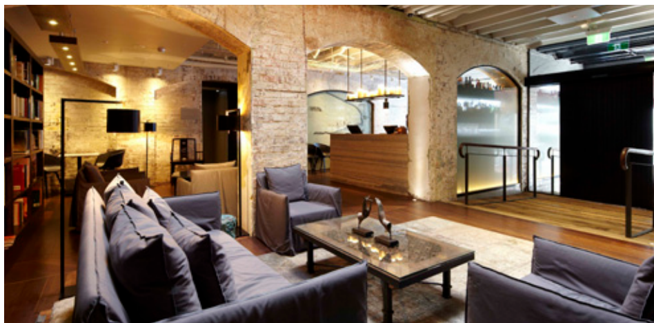
Acima: Hotel Cambridge (foto de divulgação) Canto Inferior Esquerdo: Hotel Harbour Rocks (foto de divulgação)

Claro que além de ir para um destino lindo e ter lugares incríveis para visitar, qualquer turista quer se hospedar em um bom hotel. O Harbours Rocks Hotel tem uma ótima localização e funcionários muito agradáveis para deixar todos os clientes satisfeitos. Outra excelente opção de hospedagem é o Simpson of Potts Point . O agradável boutique hotel de luxo oferece quartos confortáveis e espaçosos. Tudo para sua estadia ser a melhor possível! Hotéis com cafés da manhã deliciosos ganham ainda mais os seus clientes. É o caso do The Lord Nelson Brewery Hotel que também está localizado bem pertinho do Ópera House e da famosa região de Circular Quay. Em questão de preço e qualidade nos serviços o The Bayswater Sydney agrada bastante. Para quem gosta de baladas, o hotel está localizado pertinho do bairro King Cross. O local é cheio delas! Outra estadia bem agradável para ficar quando viajar para Sydney é o Cambridge Hotel Sydney . O Cambridge tem ótimos benefícios para seus hóspedes: boa localização, quartos muito organizados, funcionários amigáveis e prestativos e tudo num preço justo. Não tem como não voltar! Este é o melhor hostel de Sydney. Aconchegante como nossa casa e com uma atmosfera bem amigável, o Blue Parrot é ótimo para se hospedar com um grupo de amigos prontos para curtir as maravilhas de Sydney.