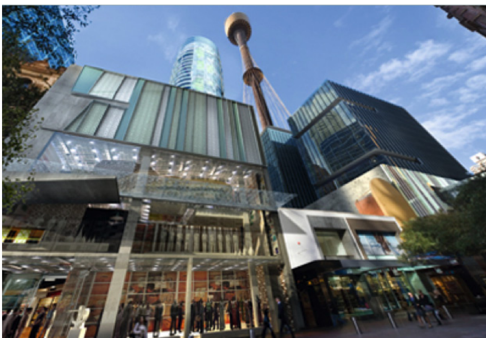
Acima: Queen Victoria Building (foto de divulgação) | Canto Inferior Esquerdo: Sydney Central Plaza Shopping Center (foto de divulgação)