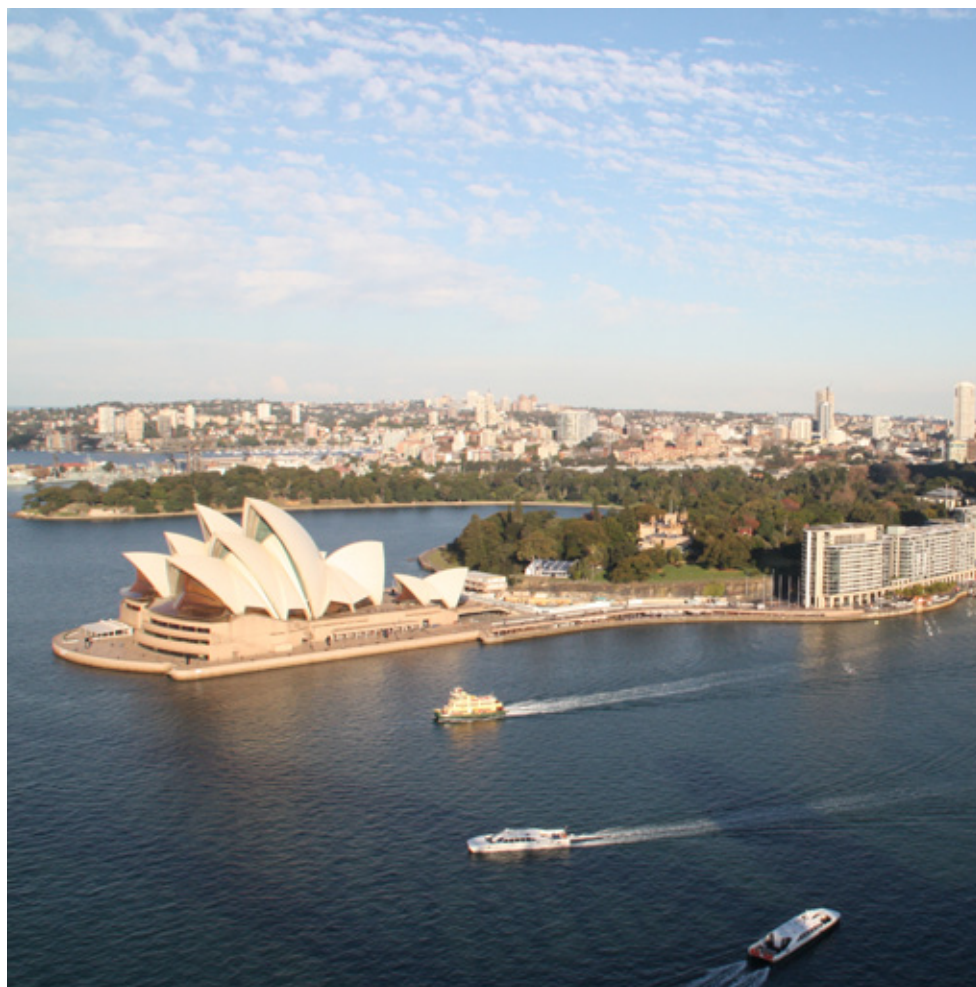
Sydney (Flavia Bravo)

A terra dos cangurus é também a mais populosa da Austrália. O lugar abriga pessoas de todos os países e diversas culturas. Os surfistas amam as belas praias que Sydney possui. O astral das pessoas é muito bom e os modernos prédios dão um ar especial ao local. Os australianos são muito amigáveis e as ruas são limpas e organizadas. Hora de pegar seu passaporte e embarcar para a simpática cidade de Sydney!