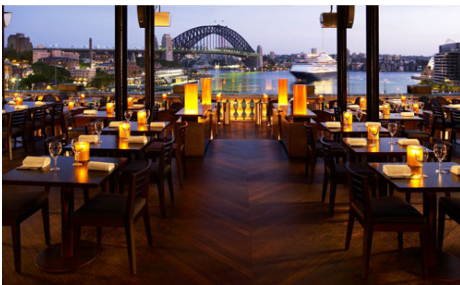
Acima: Sorvetes no Gelato Messina (foto de divulgação) | Canto Inferior Esquerdo: Café Sydney (foto de divulgação)

Na hora de experimentar a gastronomia de Sydney existem inúmeras opções. Como por exemplo, o The Commons , um restaurante e bar com pisos de madeira, móveis rústicos e modernos e um pátio nos fundos. Para comer deliciosos frutos do mar vá ao Café Sydney . Além do rico cardápio você tem como acompanhamento a maravilhosa vista da Ópera House, navios de cruzeiros ancorados no porto e a brisa refrescante do pacífico que bate nessa parte da baía. Se você gosta de cozinhar e quer mostrar um pouco dos seus dotes culinários para os amigos vá ao Phillip's Foote . Lá eles fornecem as carnes e o tempo, mas é você que comanda a grelha. Para uma refeição mais refinada o The Fine Food Store serve um ótimo café da manhã, comida contemporânea e até orgânica. Tem pratos para todos os paladares. Os elogios são unânimes quando se trata do Gelato Messina . O lugar oferece mais de 30 tipos de sorvete! Não dá pra escolher um preferido. Os bolos também são maravilhosos. Mas o que mais enche os olhos é a beleza de cada doce. São muitos formatos e cores diferentes.