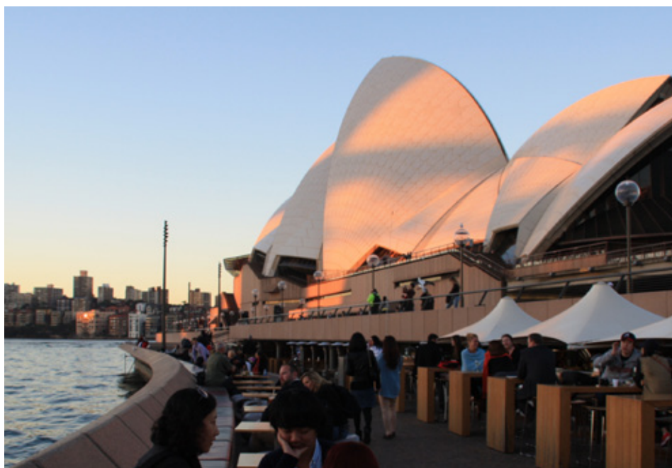
Acima: Sydney Aquarium Reef Theatre | Canto Inferior Esquerdo: Opera House (Flavia Bravo)

Bares com diferentes qualidades, pontos turísticos badalados e muito agito é o que você encontrará em diferentes horários por aqui. Em qualquer horário o Opera House é uma opção incrível de passeio. O cartão-postal de Sydney tem atrações como: teatro, ópera, restaurantes... Enfim, não é a toa que o lugar é o número 1 da cidade. E que tal curtir a noite de Sydney em um barzinho descolado? O Rockpool Bar and Grill tem pratos sofisticados e um ótimo ambiente para atender seus clientes. Praia agitada e cheia de surfistas como a Bondi Beach (uma das mais famosas da cidade) sempre é sinônimo de diversão. As crianças amam o Sydney Aquarium . Os bichinhos encantam a todos os turistas com suas graçinhas. Até os temidos tubarões são admirados. Outro ponto indispensável para visitar em Sydney é a Harbour Bridge . Depois que você escalar a ponte vai ter uma recompensa impagável: a maravilhosa vista da cidade aos seus pés.