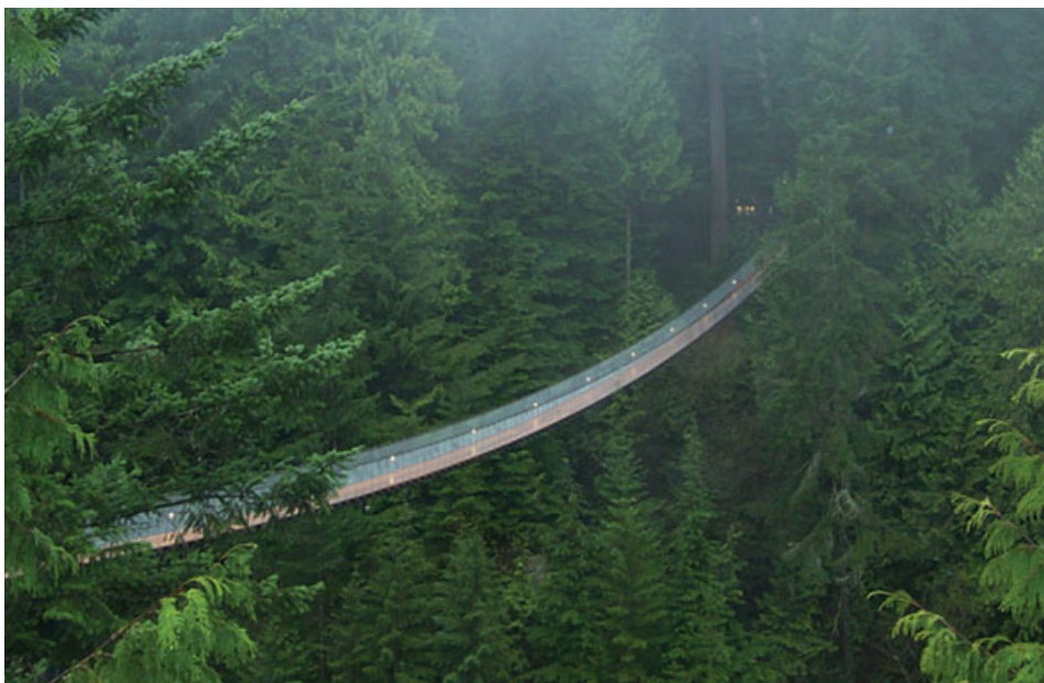
Acima: Stanley Park (foto de divulgação) | Canto Inferior Esquerdo: Ponte Capilano (foto de divulgação)

Faça uma caminhada, ande de bicicleta ou patins ao som das gaivotas no Stanley Park , o maior parque urbano do Canadá. Por suas centenas de acres há esquilos, guaxinins, lagos e muita área verde. Mais tarde curta o pôr do sol sentado de frente para a praia em um dos troncos na areia da Sunset Beach ou English Bay . Um cenário sereno e romântico. Outro parque com um clima super tranquilo é o Capilano . Possui uma ponte pênsil de 450 pés de altura e muito verde, formando uma paisagem linda. Quem gosta de uma boa leitura vai adorar a Biblioteca Central , na West Georgia Street. O edifício tem uma arquitetura que chama a atenção e um rico acervo de livros. Vale conferir a paisagem da cidade do topo do Harbour Centre , com 150 metros de altura, dá para ter uma visão panorâmica perfeita. Se prefere fazer alguns tratamentos e relaxar, escolha o Absolute Spa que já ganhou mais de 55 prêmios. O local é frequentado por celebridades como Gwyneth Paltrow, Jennifer Lopez e Zac Efron.