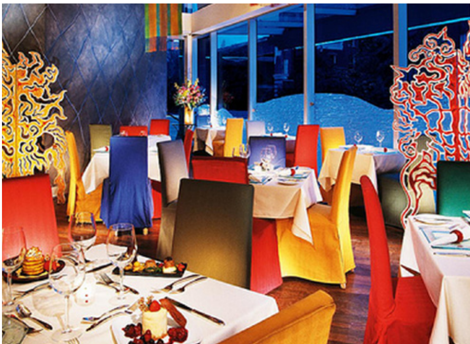
Acima: Tim Horton's Coffeepot (foto de divulgação) | Canto Inferior Esquerdo: Indigo (foto de divulgação)