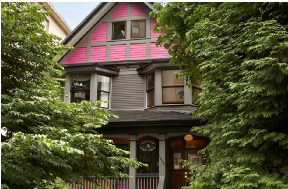
Acima: YWCA Quarto Duplo (foto de divulgação) | Canto Inferior Esquerdo: West End Guest House (foto de divulgação)

Para aproveitar ainda mais a estadia em Vancouver, nada como desfrutar dos mimos e luxos do The Sutton Place Hotel . Este é um dos hotéis boutiques mais bonitos da cidade e está localizado próximo a rua de compras Robson Street. O Empire Landmark Vancouver é outro hotel sofisticado que surpreende pela região. No bairro de English Bay, garante ao hóspede uma vista incrível do pôr do sol em frente à praia. O Comfort Inn Downtown Vancouver é ideal para quem não quer gastar muito, mas ainda deseja algumas regalias. Está a dois minutos do Teatro Vogue e oferece passe VIP às principais casas noturnas da cidade. Uma ótima opção para quem quer se divertir e economizar. Quem procura conforto sem gastar muito vai adorar o YWCA Hotel . Localizado no centro de Vancouver, perto de tudo, oferece quartos individuais e compartilhados a um preço baixo. Se você faz questão de se sentir em casa, opte por um Bed and Breakfast como o West End Guest House . Essa casa antiga, de 1905, é repleta de antiguidades vitorianas e possui um ambiente aconchegante e caseiro.