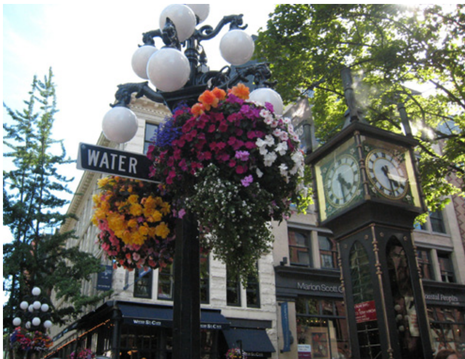
Acima: Holt Renfrew Vancouver (foto de divulgação) | Canto Inferior Esquerdo: Gastown (foto de divulgação)

O bairro de Gastown está cheio de lojas com souvenirs de Vancouver, além de conter o famoso relógio a vapor. Outro local perfeito para as compras é a Robson Street . Possui diversas lojas para todos os bolsos, como American Eagle, Guess e Armani Exchange. A loja de departamentos Hudson's Bay Company é a primeira e a mais famosa do Canadá, onde você encontra peças de roupa na moda e super em conta. Já quem está disposto a pagar um pouco mais, a Holt Renfrew é uma loja de departamentos de luxo com mais de 12.700 metros e marcas de celebridades como Twenty8Twelve, da atriz e modelo Sienna Miller, e Dolce & Gabbana. Quer encontrar de tudo? O Metropolis Metrotown é o segundo maior shopping do Canadá, com mais de 500 lojas, o lugar onde a cidade inteira se encontra.