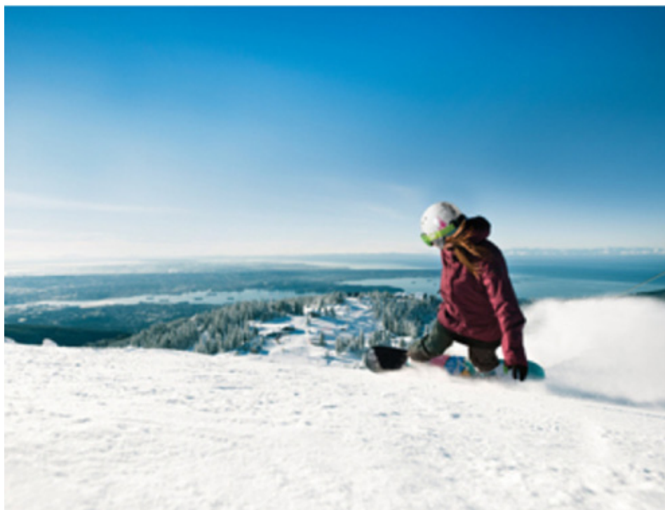
Acima: Canada Place (foto de divulgação) | Canto Inferior Esquerdo: Grouse Mountain (foto de divulgação)

No verão ou no inverno, a Grouse Mountain é o lugar perfeito para os esportistas. É o principal point da cidade para esquiar e praticar snowboard. Contudo, durante o calor você ainda pode fazer hiking e subir a montanha. Quem procura um programa mais tranquilo deve ir ao Canada Place . O local abriga eventos e exposições, além de ser cartão-postal de Vancouver. Se você gosta de animais assista o show com as belugas (baleias brancas) no Vancouver Aquarium . Nada mais canadense do que assistir um jogo de hóquei do Vancouver Canucks em um pub como o Forum Sports Bar tomando uma cerveja Granville Island, produzida na região. Quem gosta de dançar deve optar pela casa noturna Au Bar . O ambiente moderno e jovem recebe canadenses e estrangeiros.