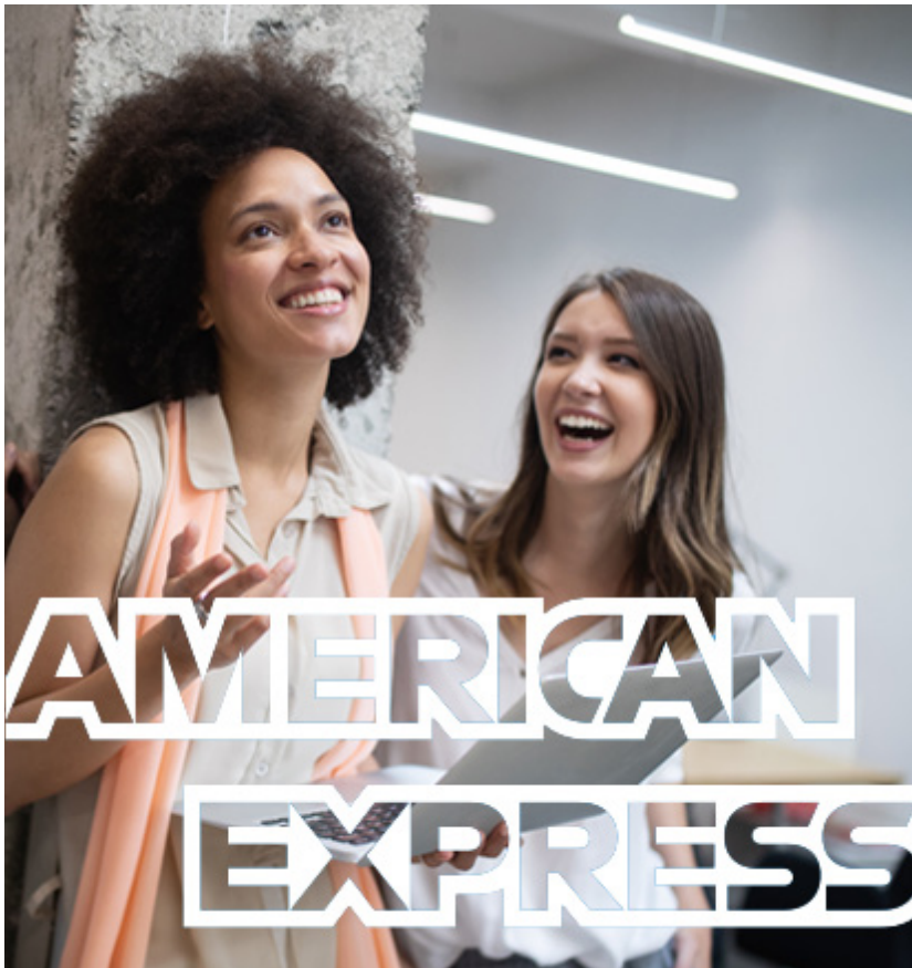
TABLA DE CONTENIDOS DE LA GUÍA DE REMESAS PARA GLOBAL DOLLAR CARD