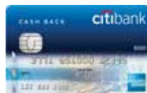
Citibank Cash Back American Express® Card