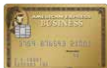
美國運通商務金卡