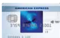
美國運通Blue Cash SM 信用卡