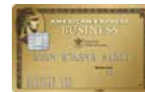
香港牙醫學會 美國運通商務金卡