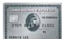
美國運通半島白金卡