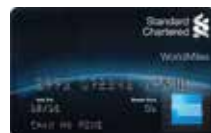
渣打WorldMiles American Express® 卡