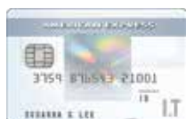
美國運通 IT Cashback卡