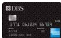
The DBS Black American Express® Card