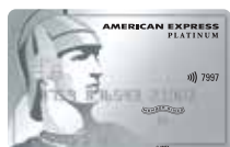
美國運通白金信用卡