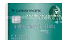
美國運通 國泰航空公司卡