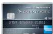
美國運通 國泰航空尊尚信用卡