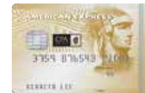
澳洲會計師公會 美國運通信用卡