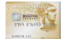
香港測量師學會 美國運通信用卡