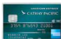
美國運通 國泰航空信用卡