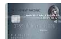
美國運通 國泰航空尊尚公司卡