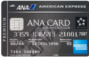
ANA アメリカン・エクスプレス®・プレミアム・カードをお持ちの方