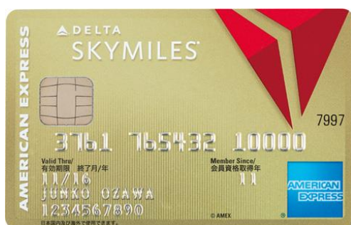
デルタ スカイマイル アメリカン・エクスプレス®・ゴールド・カード

アメリカン・エクスプレスでは、今後もお客様にとって利便性が高く価値のあるサービスの提供に努めてまいります。