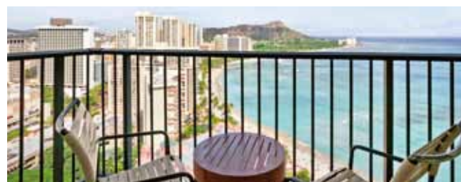
シェラトンワイキキホテル眺め一例(イメージ)

※2018年9月26日時点での検索に基づくもので、時間の経過により、掲載の価格と一致しない場合があります。最新の空席状況・料金はお問い合わせください。