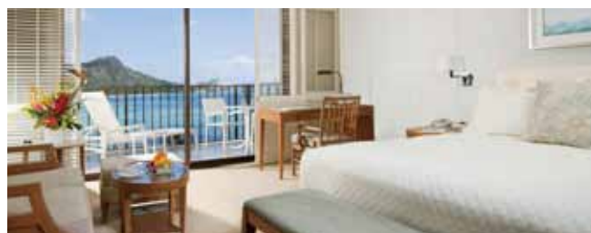
ハレクラニお部屋一例(イメージ)

カード会員様の理想の旅をご提案「H.I.S. アmerican・エクスプレス・トラベル・デスク」