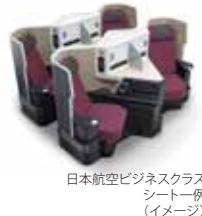
日本航空ビジネスクラスシート一例(イメージ)

快適なビジネスクラスのフライトとグレードの高いホテルでの宿泊。ハワイを思い切り満喫するためのプランを、旅のプロフェッショナルとご相談いただけます。