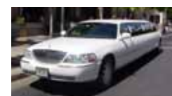
リムジン(イメージ)

H.I.S. おすすめのホテルで、眺めのいい高層階に滞在できるプランです。さらにプライベートリムジンの送迎や朝食サービスも。早期申込割引なら旅行代金もお得です。